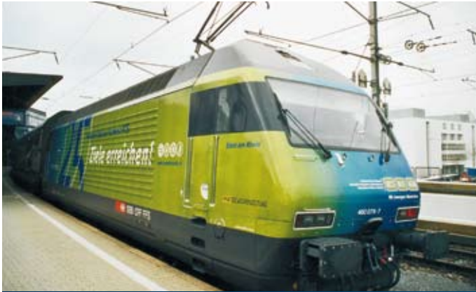
Lieferbar ab Oktober 2004