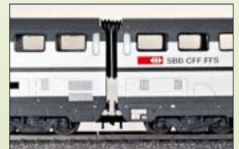
1. Kinematik-Schaft und Fleischmann-Kurzkupplung

Nur bei den Varianten 1, 3 und 4 wird der Schaft in die Richtung der befahrenen Kurve gezwungen, wobei nur Variante 1 und 4 wirklich kurz gekuppelt sind.