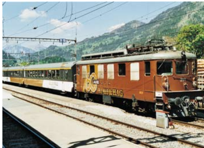
So, wie die Ae 415 251 im Bahnhof Zweisimmen stand, wird sie bis zu ihrer Stilllegung unterwegs sein.

Gezogen wurde der «Golden Pass Express» von der 60-jährigen Ae 415 251. Das wiederum gab der BLS und HAG Gelegenheit, Original und Modell gleichzeitig einem breiten Pub-