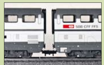
3. Normal-Schaft und Fleischmann-Kurzkupplung