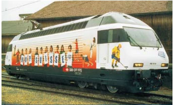
Lieferbar ab Oktober 2004

Re460 Magic Ticket, Art.Nr. 280~/281= Magic Ticket