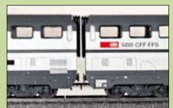
4. Kinematik-Schaft und HAG-Starr-Kupplung