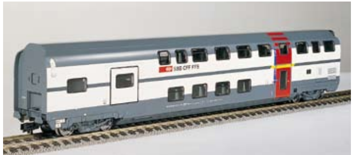
Lieferbar ab Januar 2005

Ae 4/4 BLS «60 Jahre», Art.Nr. 182~/183= 60 Jahre