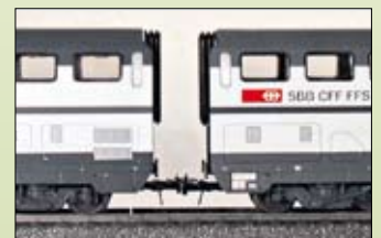
2. Kinematik- oder Normal-Schaft und Bügelkupplung