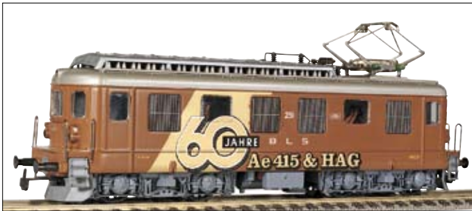
Lieferbar ab Oktober 2004

Re460 Magic Ticket, Art.Nr. 280~/281= Magic Ticket